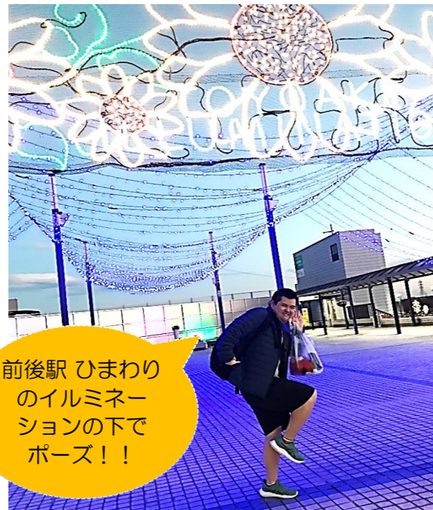
前後駅 ひまわりの イルミネーションの下で ポーズ！！