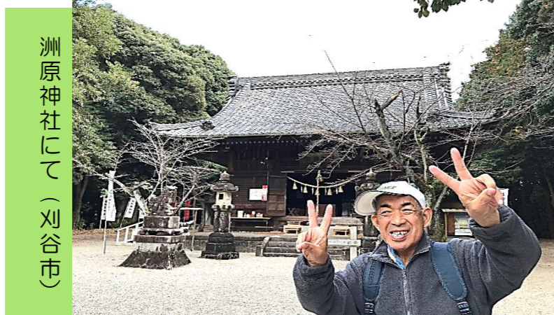
洲原神社にて（刈谷市）