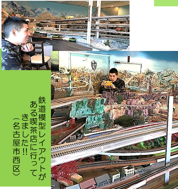
鉄道模型レイアウトが ある喫茶店に行っ てきました！！ （名古屋市西区）