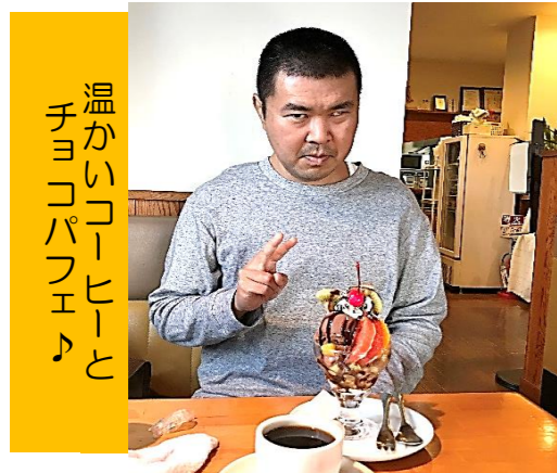
温かいコーヒーと チョコパフェと