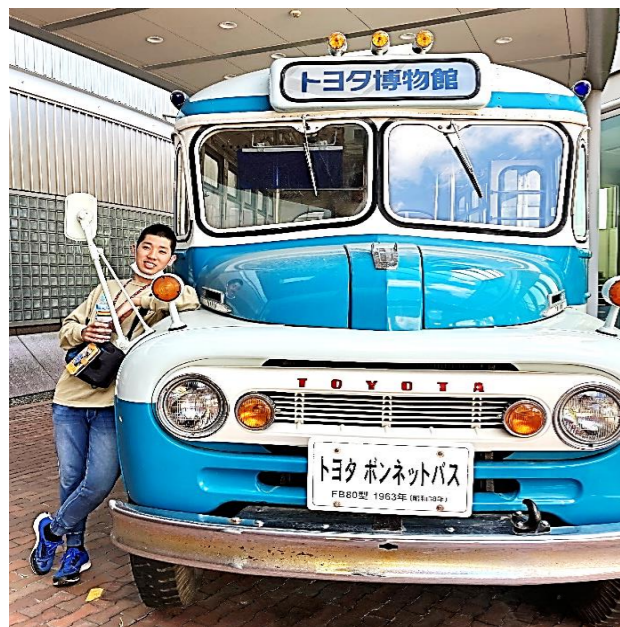
トヨタ博物館にて

休業期間中に頂いたお問合せについては、1月4日以降に順次回答させていただきます。ご不便をおかけいたしますが、ご理解のほどお願いいたします。