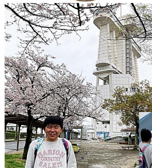
名古屋港水族館へ♪ ポートビルと桜の前で😊