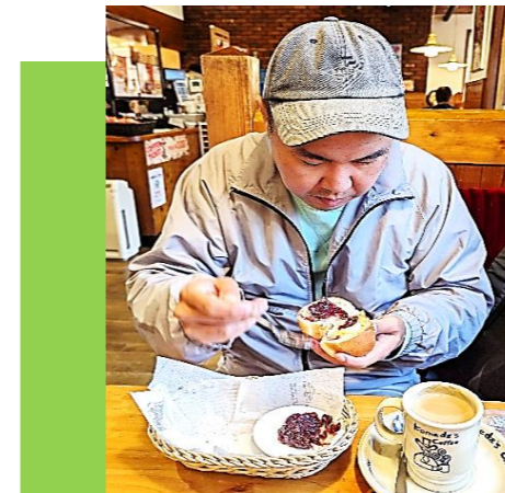
モーニングは あんトーストで決まり♪ (コメダ珈琲店にて)