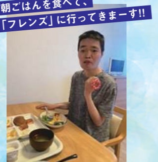
朝ごはんを食べて、 「フレンズ」に行ってきたーす!!