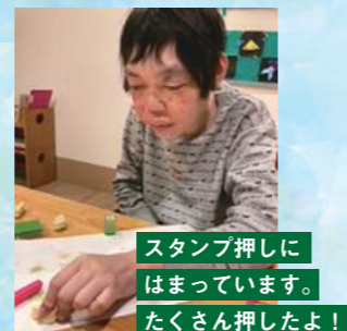
スタンプ押しに はまっています。 たくさん押ししたよ!