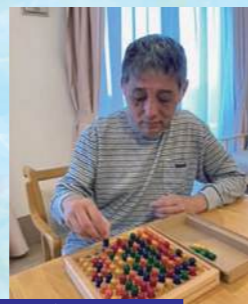
お気に入りのボードゲーム。 きれいに並べると気持ちいい(^_^)☆

令和6年2月に「えみふるの家沓掛D」が開所し、「えみふるの家沓掛 A・B・C・D」と「みさき館」を併せて定員20名のグループホームとなりました。「えみふるの家沓掛C」も週3泊から週5泊に変更し、ホームで過ごす日数が増えました。ますますにぎやかになったホームの様子をご紹介します。皆さん素敵な笑顔です!