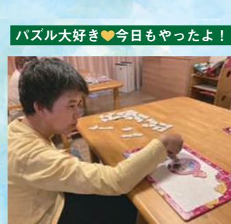
パズル大好き♥今日もやったよ!