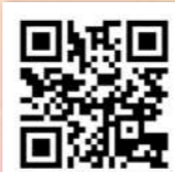
「ホームページ」 「ブログ」