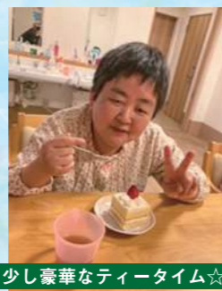
少し豪華なティータイム☆ みんなで食べると美味しいね