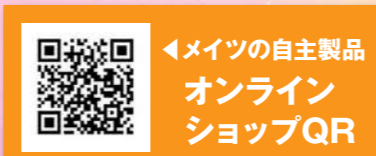
「メイツの自主製品 オンライン ショップQR」