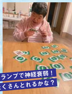
トランプで神経衰弱! たくさんとれるかな?