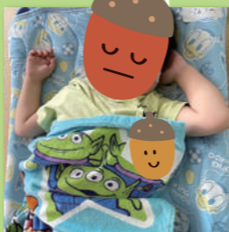
たくさん遊んだ後は…Zzzz…