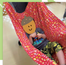
ゆらゆらシートブランコ