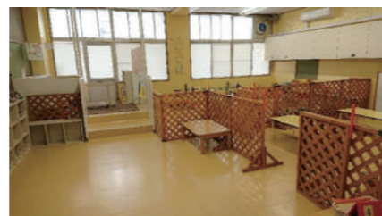
◎どんぐり教室（児童発達支援） 現在、「いちご」、「ばなな」、「めろん」の3クラスあります。