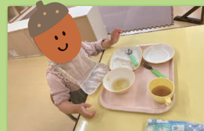
給食、おいしく完食しました!