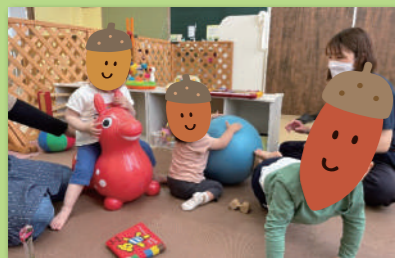
いろいろな玩具がある室内遊び（自由遊び）♪ 楽しく手先や身体を使って遊んでいます!!