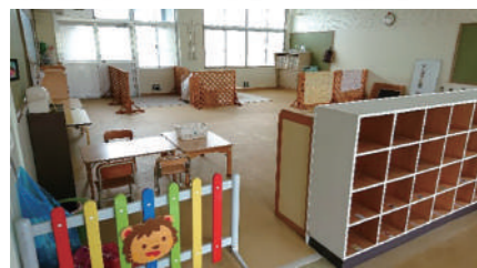
◎たんぽぽ教室（親子通所） 火曜日クラスと水曜日クラスがあり、週1日親子で通所しています。