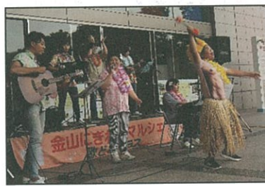
「金山マルシェ」@金山駅 - R 1. 6. 9 -