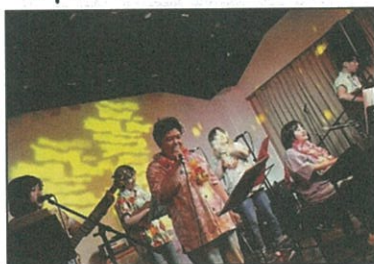
「最も自由な人たち」@栄 - R 1. 5. 26 -

LIVE 様々なライブに出演！！ 各所で“ハロハロマハロ旋風”を巻き起こしました🎵