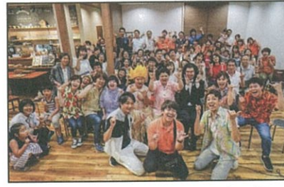
「いきるよろこひ」@知多 - R 1. 8. 9 -